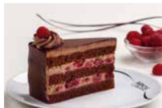
Čokoladna torta s malinama