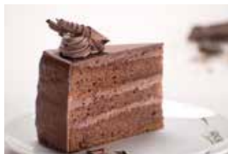
Tradicionalna torta kakao/čokolada