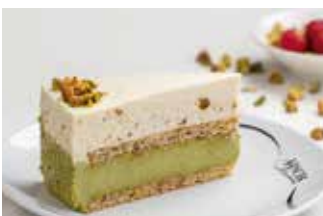
Pistacija i bijela čokolada