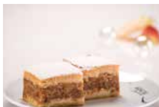
Pita od jabuka