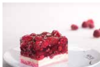
Voćna šnita s malinama