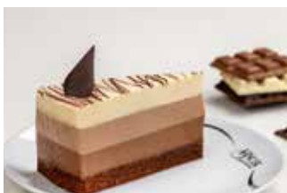
Čokoladni trio mousse