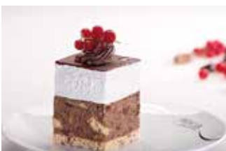
Voćna punč kocka