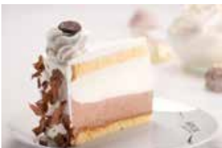
Parfe torta - vanilija/čokolada