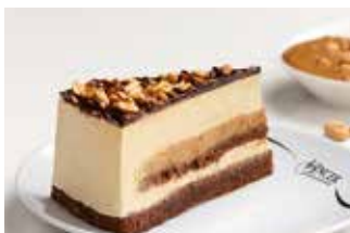
Sniki kikiriki torta