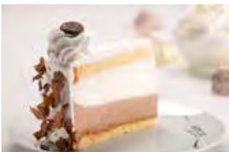
Parfe torta - vanilija/čokolada