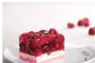
Voćna šnita s malinama