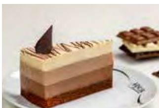
Čokoladni trio mousse