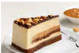
Sniki kikiriki torta