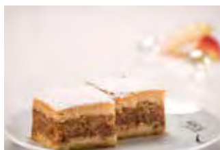
Pita od jabuka