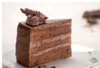
Tradicionalna torta kakao/čokolada