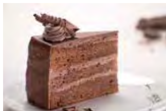
Tradicionalna torta kakao/čokolada