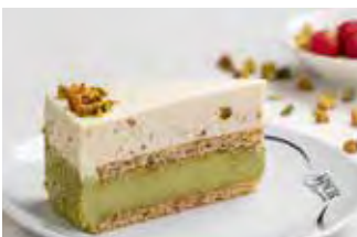
Pistacija i bijela čokolada