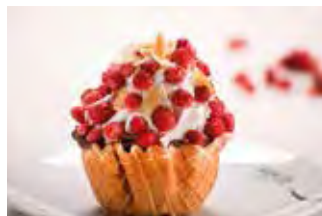
Košarica sa šum. jagodama