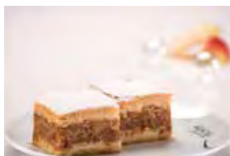
Pita od jabuka