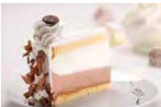
Parfe torta - vanilija/čokolada