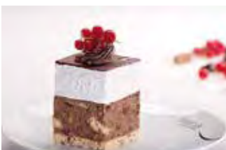
Voćna punč kocka